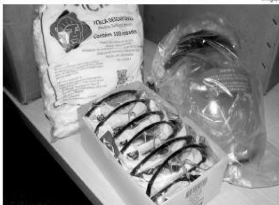
DOAÇÕES Campanha arrecada produtos necessários no combate ao coronavírus

O grupo elegeu os Objetivos 3 e 17 (Saúde/Bem Estar e Parceria/Melo de Implementação) para promover aquisição de EPI (Equipamento de Proteção Individual - EPIs) e